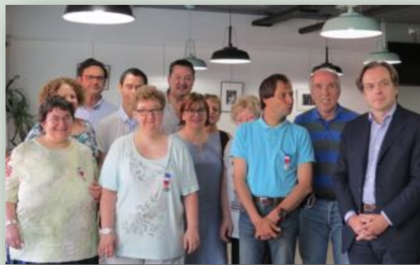
Félicitations aux médaillés !

travail et d'engagement qui étaient récompensées. Des années qui démontrent l'importance de la vie professionnelle dans l'épanouissement de chacun d'entre nous.