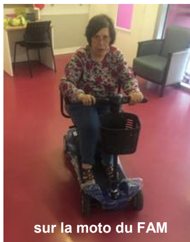
sur la moto du FAM

Il y a une négociation permanente entre le soignant et le résident âgé afin d'éviter toute maltraitance. En effet, si une personne refuse de se laver et qu'on la laisse ainsi : c'est de la maltraitance ; si elle est lavée contre sa volonté : c'est aussi de la maltraitance. Alors on peut lui