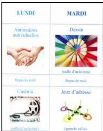
Extrait d'un Programme hebdomadaire affiché en maison de retraite