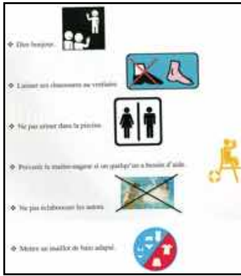
Page d'un fascicule sur les règles de civisme à la piscine pour les usagers d'un CITL