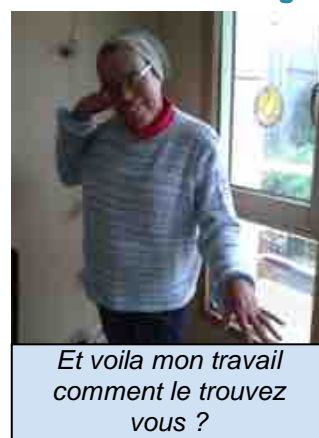
Et voilà mon travail comment le trouvez vous ?

Après : J'étais tellement fière de voir que mon travail s'achevait et que j'allais enfin pouvoir admirer mon chef d'œuvre, je savourais le moment de pouvoir l'enfiler à la bonne saison puisqu'il a été terminé en septembre. Ouf, j'ai réussi mon challenge. Et, pour une première,